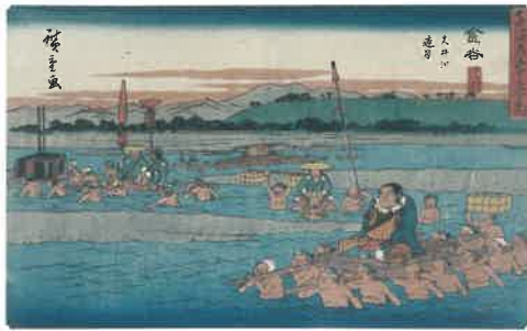
歌川広重 行書版東海道 金谷