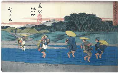
歌川広重 行書版東海道 藤枝