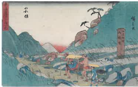
歌川広重 行書版東海道 稲穂