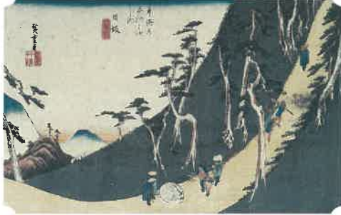
歌川広重 保永堂版東海道 日坂