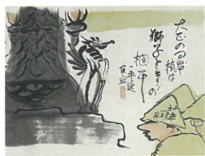
東海道五十三次漫画絵巻(日本橋) 岡本一平 大正11年(1922) 当館蔵

明治のはじめに宿駅が廃止されて50年を経過した大正期には、鉄道開通や、自動車の普及によって徒歩の旅は過去のものになりました。一方で画家や漫画家、文学者たちの間では、江戸時代の旅を懐古し、東海道を旅行して作品にする例が数多く見られます。また、浮世絵の復刻や現状写真によって広重作品と比較する書籍の出版などもおこなわれています。本展では、それらの作品を通して「旧道」の文化的価値について考えます。