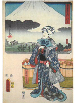
双筆五十三次 はら歌川広重・三代歌川豊国 安政2年(1855) 当館蔵

風景画を得意とする歌川広重と人物画を得意とする三代歌川豊国が合作した、描き分けの東海道続絵です。各図の上部枠内に広重が宿場の風景を描き、下半分に三代豊国がその宿場に関係のある風俗や人物を描いています。