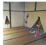
本陣のおばけ屋敷