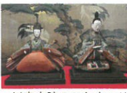
二川宿本陣のひなまつり

◎都合により、掲載内容を変更、あるいは行事を中止する場合があります。ホームページ・電話等でご確認ください。