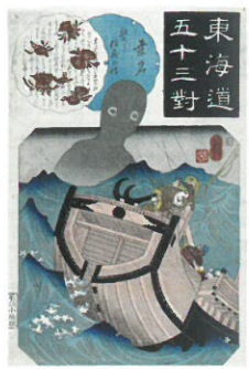
東海道五十三対 桑名歌川国芳 弘化年間頃 当館蔵

東海道五十三対は、幕末の歌川派を代表する三代豊国・国芳・広重が各宿を分担して描いた東海道揃物のひとつです。和歌や新旧の文学作品、各地の伝説から浄瑠璃・歌舞伎といった芸能に至るまで、連綿と続いてきた東海道という地域・街道にまつわる文化的な積み重ねを再利用して、各宿を紹介するものでした。本展では、浮世絵とその画題の源泉となった書籍などをあわせて展示します。